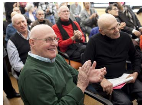
Arriba: La gran inauguración del Centro SAGE abajo: SAGE en NYC Pride 2012